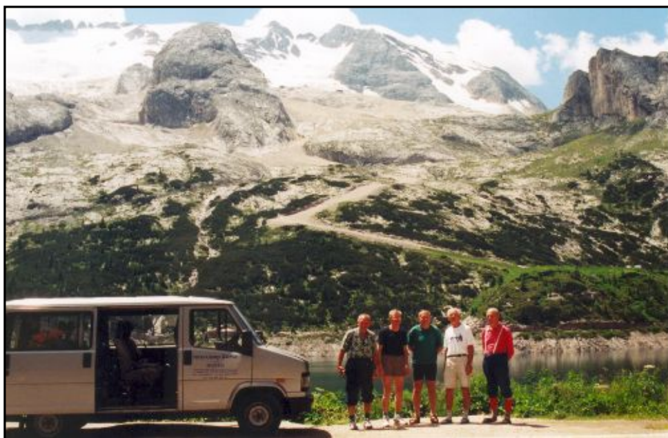
Skupina VHT pod královnou Dolomit Marmoladou 3343 m

Zásadní zlom přinesla sametová revoluce v roce 1989, kdy se konečně otevřely hranice a bylo možno vyjet do všech ostatních evropských horských a vysokohorských oblastí. V této době došlo také k vytvoření samostatné skupiny vysokohorské turistiky v rámci OPT TJ Kotvy Braník. Byly zpracovány interní bezpečnostní předpisy, týkající se pohybu v horách / Minimum VHT /, Ústředím VHT v rámci KČT byli vyškoleni noví cvičitelé a vedoucí VHT, byl prováděn výcvik na skalních partiích v terénu / Černolice, Šárecké údolí, Bořeň u Bíliny, Českomoravská Vysočina /. Členem skupiny VHT je i lektor sekce VHT KČT, který má oprávnění pro zkoušky cvičitelů a vedoucích VHT. Tím byli vytvořeny předpoklady pro předem plánovaný a organizovaný rozvoj činnosti.