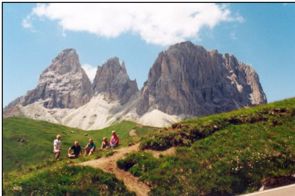
Skupina VHT v Dolomitech

umožňovalo zejména členství účastníků v rakouském Alpenvereinu /OEAV/. Při plánování činnosti byla snaha o poznání pokud možno co nejširšího počtu horských oblastí, což je zřejmé i z přehledu uskutečněných akcí.