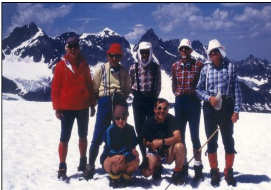
Silvretta1993, v pozadí Pizbuin 3312 m

Členská základna OPT se od roku 1981 udržuje stále okolo 150-ti členů. Aktivních je přes 60%, i když průměrný věk je asi 60 let.